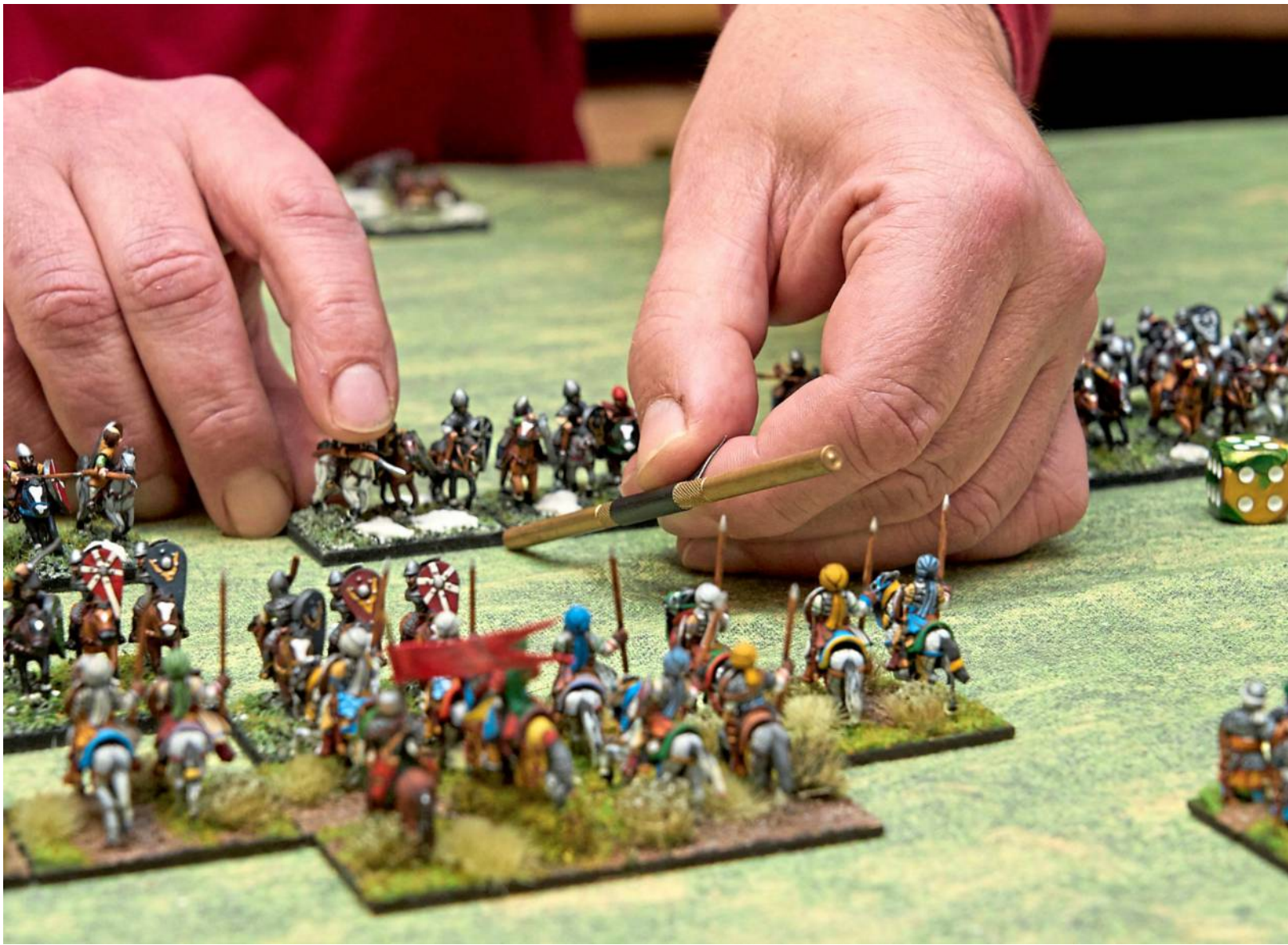
Es kommt wie beim Schachspiel auf die richtige Strategie an, wenn man eine historische Schlacht gewinnen will.