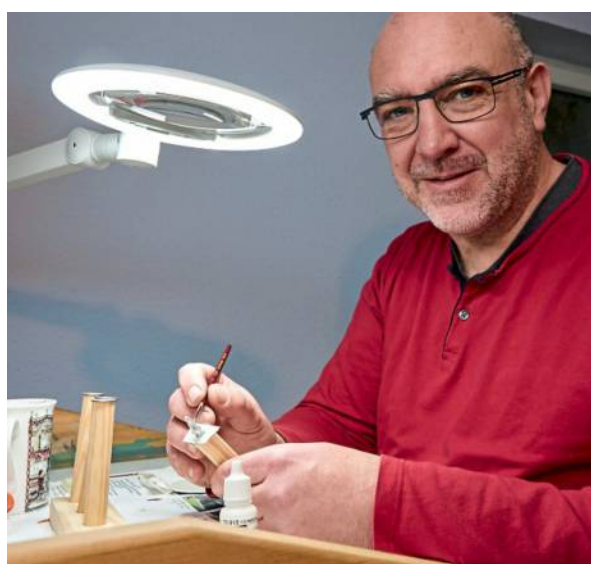
Erst wird gebastelt und gemalt, dann gespielt.

Zuschauer sind herzlich willkommen, wenn in der Zehntscheuer am Kelterplatz 8 in Ludwigsburg-Poppenweiler am Wochenende 28. und 29. Januar das Turnier „Swabian Open“ ausgetragen wird. 25 Teilnehmer aus Deutschland, Italien, Dänemark und England werden an diesen beiden Tagen bei einem Spiel Schlachten simulieren, die während des Frankenreichs im frühen Mittelalter ausgetragen worden sind. Gespielt wird am Samstag von 9 bis 12.30 sowie von 14 bis 17.30 Uhr und am Sonntag von 8.30 bis 12 Uhr sowie von 13 bis 16.30 Uhr. (mb)