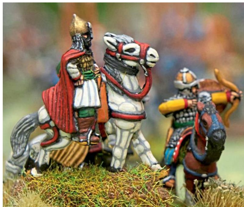
Detailgetreu sind die einzelnen Figuren gestaltet.