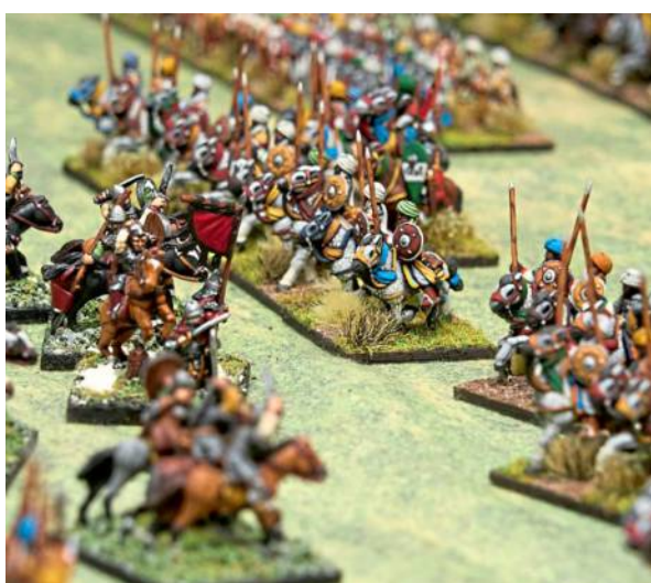
Gespielt wird nach klar definierten Regeln.